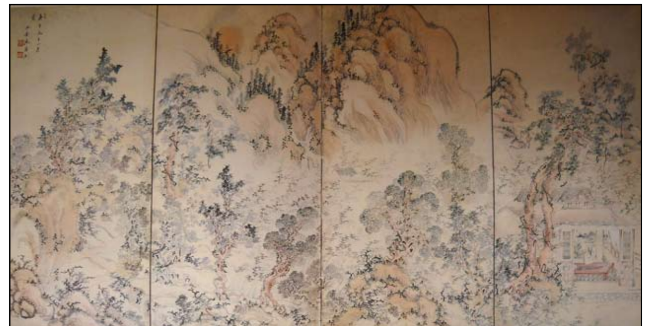
Ike no Taiga (1723-1776): Gentiluomo in visita a un eremo - (particolare)

L'inchiostro "pesante", denso, qui non è mai utilizzato per rendere i contorni generali del paesaggio, per i quali invece Taiga si serve di linee spesse, grosse, ondulate, fluide, di colore grigio più o meno luminoso.